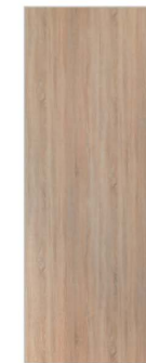
Dekor Eiche hell