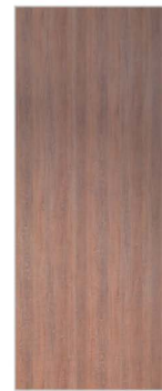
Dekor Eiche dunkel